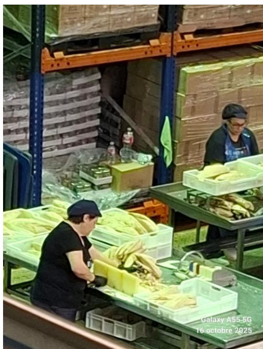
Visite de la conserverie d'anchois EMILIA de Santoña ! Les profs avant et après !