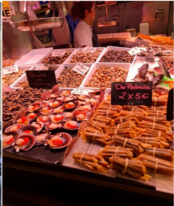
Le Marché couvert de coquillages et poissons