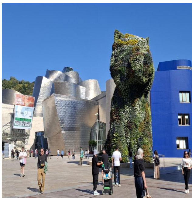
Le Fameux Puppy de Jeff Koons