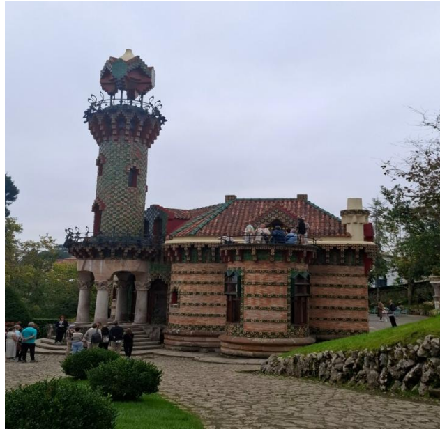
El Capricho de Gaudí