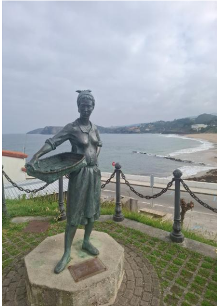
La plage de Comillas