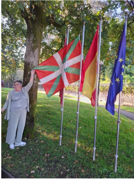
Notre guide et le drapeau du Pays Basque