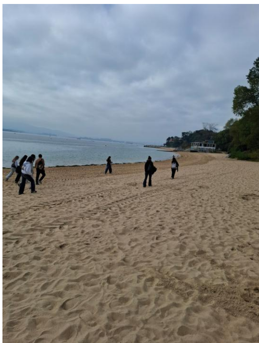
La plage del Sardinero