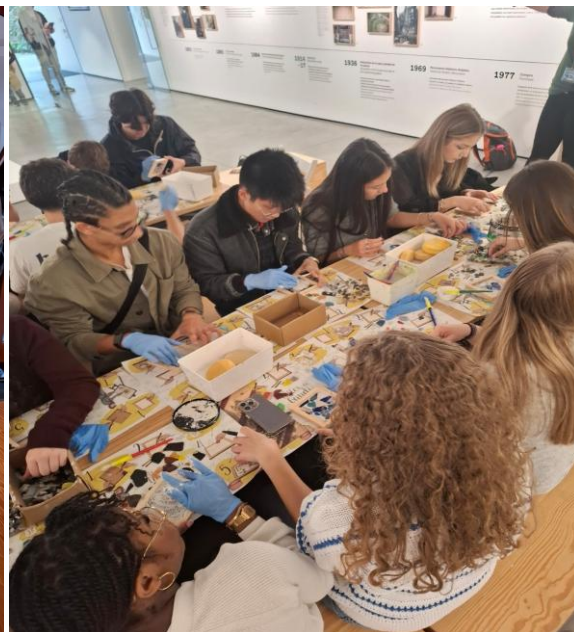
Les profs testent le mobilier Art Nouveau ! Et les élèves collent la céramique !