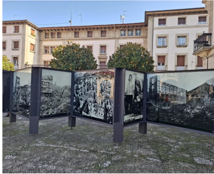
Le musée de la Paix