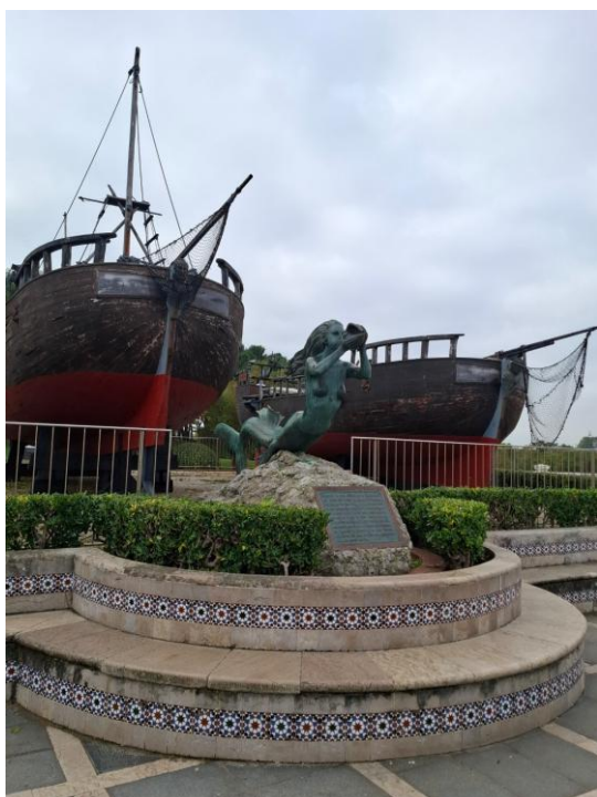
- La Sirena