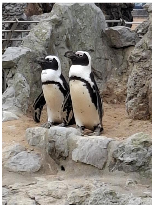
Les pingouins —..