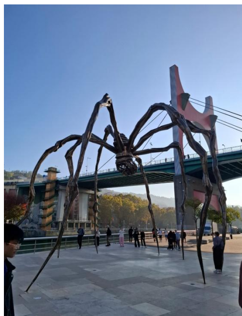
L'araignée de Louise Bourgeois