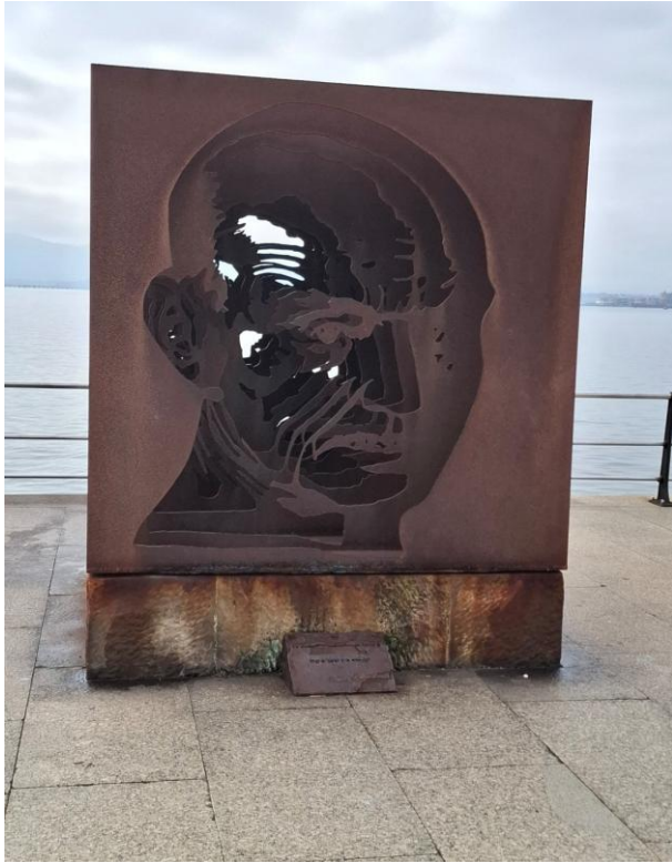
El paseo de Pereda